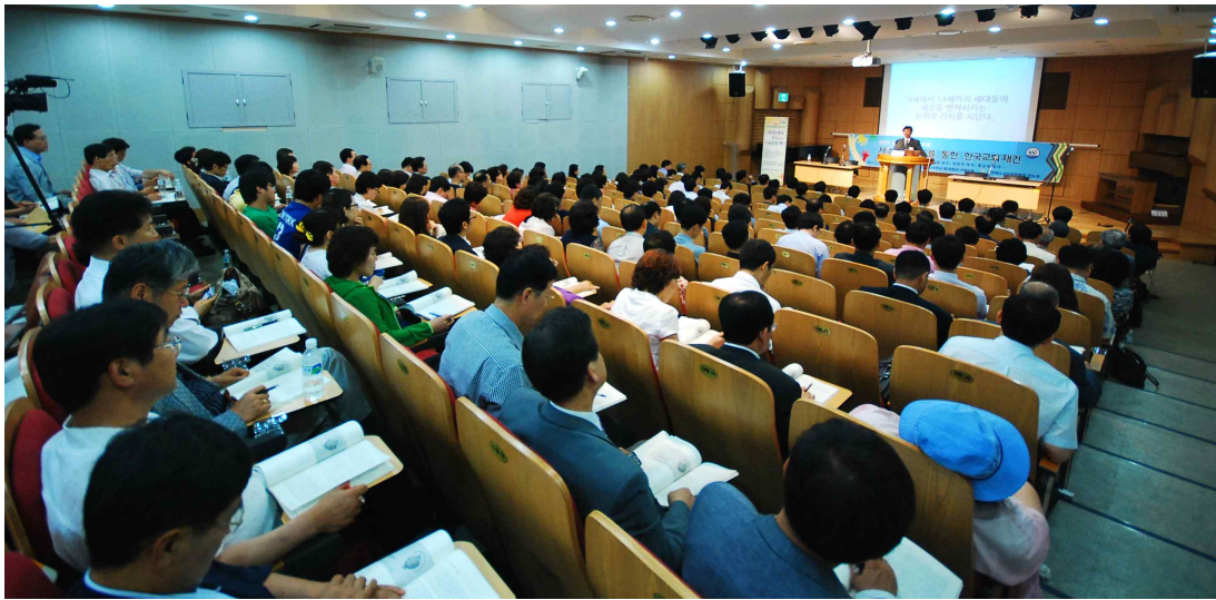
이전 포럼 현장